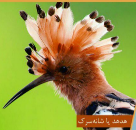
هدهد یا شاه‌سُرک

هدهد یا شاه‌سُرک از جمله پرندگان معروف ادبیات فارسی است. این پرندۀ را نماد خوش‌خبری و مزۀ‌دهی معرفی نموده‌اند. چنانکه در منطق‌الطیر عطار سرگروه نسی مرغی است که سفر به کوه قاف برداند و همچنان حافظ هم هدهد را نماد خوش‌خبری می‌داند.