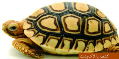
کشف یا لاک پشت

مرکز حیوانی تایگر، کلینیک دام پزشکی کوچک و سرپناهی برای حیوانات سرگردان و آن دسته حیواناتی که در کابل یا نواحی افغانستان از آنان کار کشیده می شود می باشد. این مرکز از سال ۲۰۰۴ در افغانستان آغاز به فعالیت نموده و تیم کارکنان این شهر و نواحی افغانستان هستند. هدف این مرکز خدمات حیوانی، کمک به حیوانات بی خانمان، مریش و بازخیمی است که از موضوعاتی چون سرما، گرگسنگی از خم های در زمان نرسیده و دیگر مشکلات رنج می برند. این مرکز تعداد زیادی از سگ ها و گربه های بی سرپناه را جمع آوری نموده و از آنان ناز می کند تا آنکه خانه ای خوبی پیدا کنند. مراقبت می کنند.