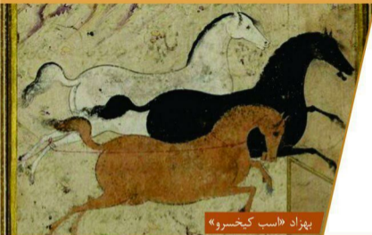
بِهزاد «اسب کبخسرو»