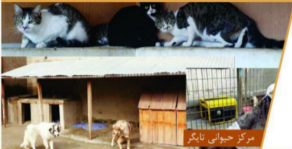
مرکز حیوانی تایگر